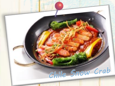
Chile Snow Crab