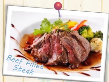
Beef Fillet Steak