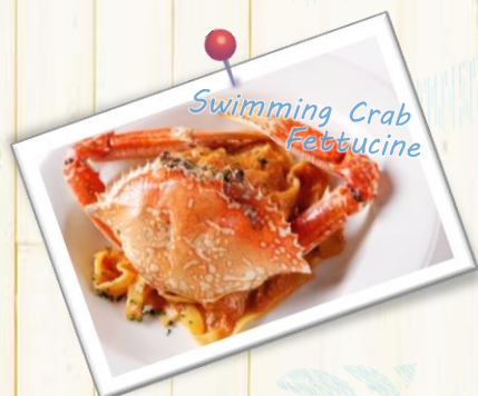
Swimming Crab Fettucine